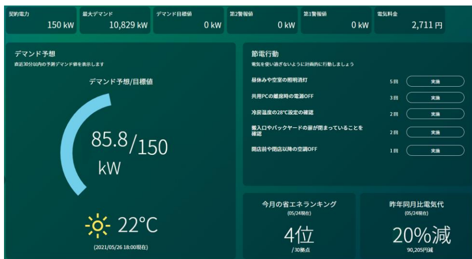
▲シンプルで見やすいダッシュボード/ユーザー専用インターフェース